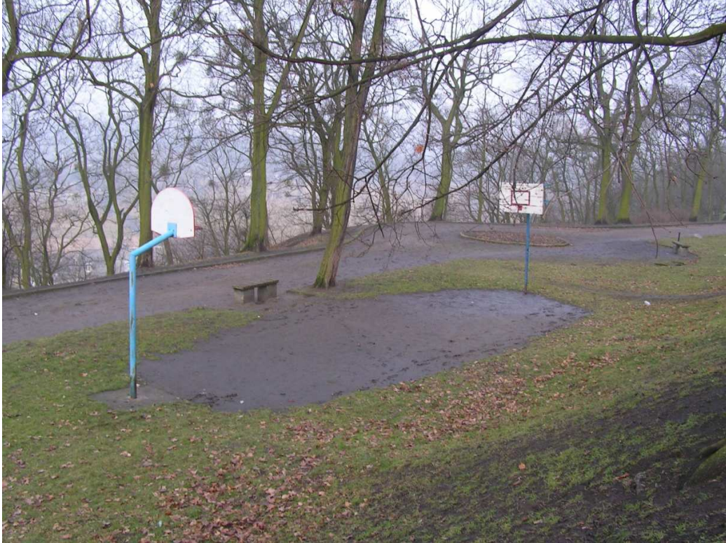
Chełmno, ul. Stare Planty, Boisko do koszykówki o nawierzchni gruntowej.