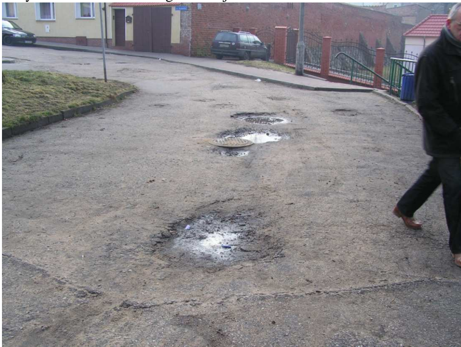
Chełmno, ul. Stare Planty, Widok alei głównej od strony ul. od strony ul. Rynkowej.