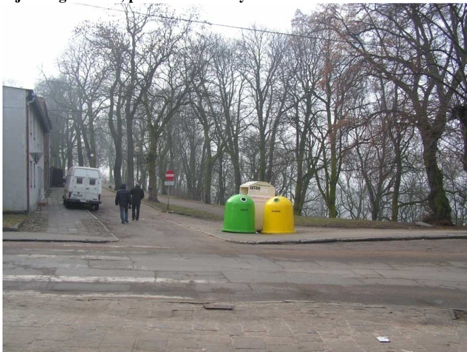
Chełmno, ul. Stare Planty, Widok parku od strony ul. Kamionka.