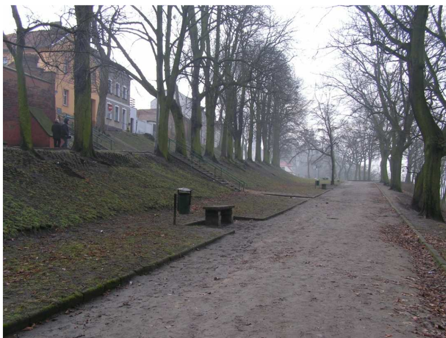
Chełmno, ul. Stare Planty, Aleja na środkowym tarasie – widoczna nawierzchnia gruntowa, kosz na śmieci i ławeczka.