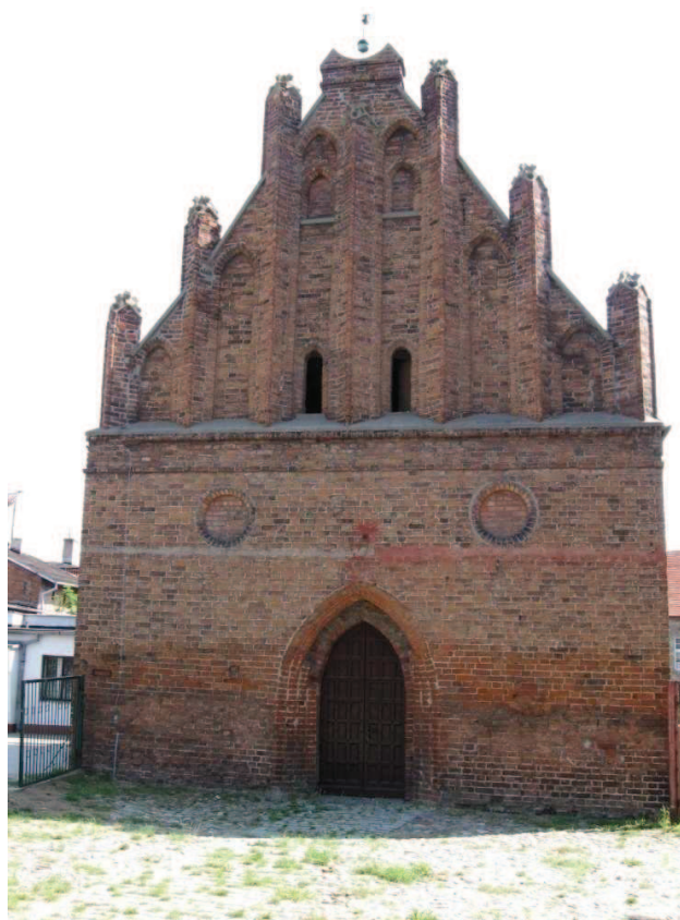
Chełmno (przy ciągu pieszym pomiędzy ul. Toruńską a 22 Stycznia) Kaplica św. Marcina – widok elewacji frontowej z wejściem głównym.