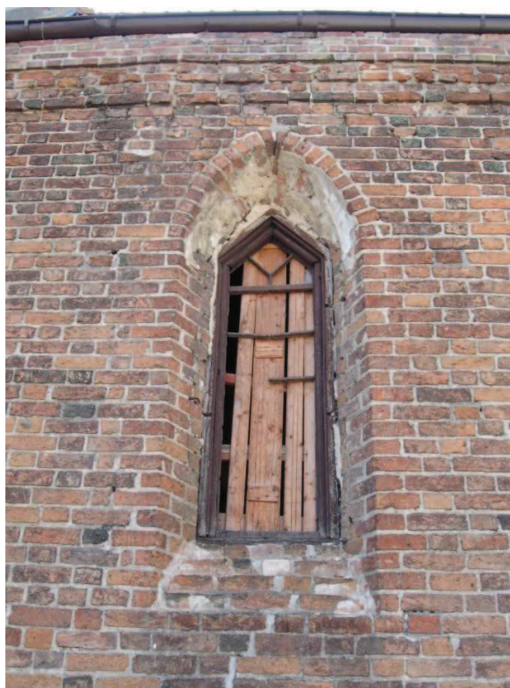
Chełmno (przy ciągu pieszym pomiędzy ul. Toruńską a 22 Stycznia) Kaplica św. Marcina – stolarka okienna.