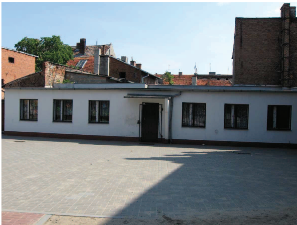
Chelmno, ul. 22 Stycznia, Świetlica i Biblioteka Szkoły Podstawowej nr 2 – widok z dziedzińca szkolnego, na prawo (poza kadrem) znajduje się kaplica św. Marcina.