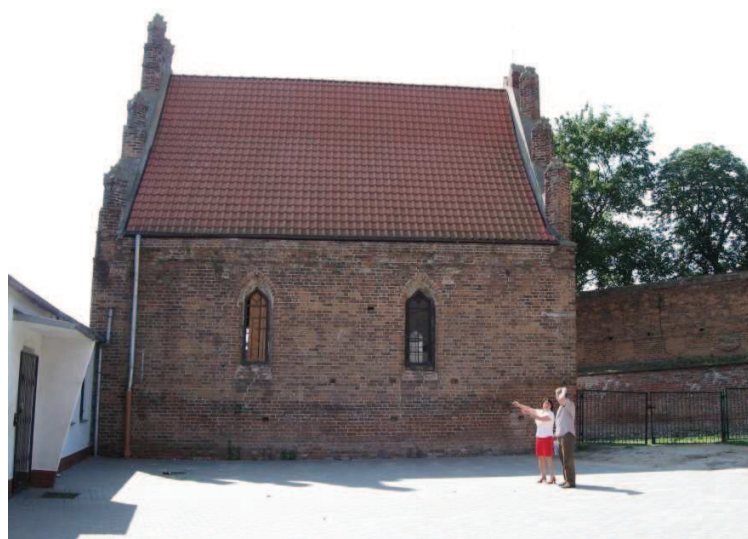
Chełmno (przy ciągu pieszym pomiędzy ul. Toruńską a 22 Stycznia) Kaplica św. Marcina – widok elewacji bocznej od strony dziedzińca szkolnego.