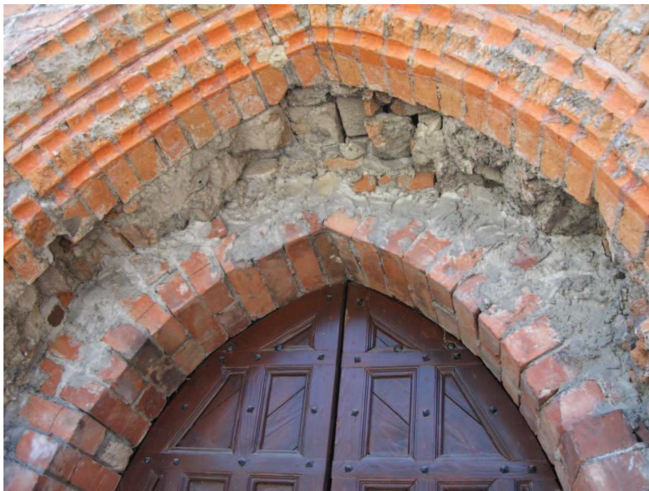
Chełmno (przy ciągu pieszym pomiędzy ul. Toruńską a 22 Stycznia) Kaplica św. Marcina – portal wejściowy, widoczne ubytki cegieł i stan struktury wnętrza muru.