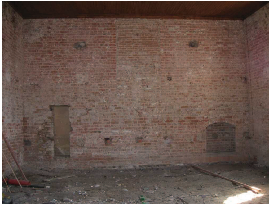
Chełmno (przy ciągu pieszym pomiędzy ul. Toruńską a 22 Stycznia) Kaplica św. Marcina – wewnątrz, widoczny brak posadzki i stan ścian.