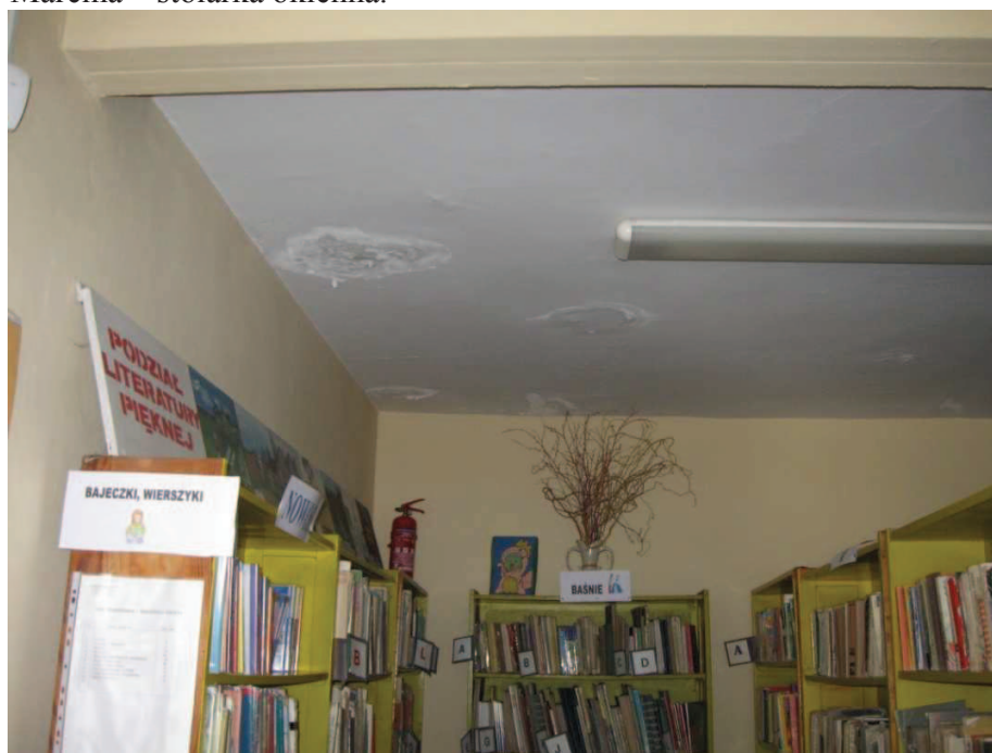
Chełmno, ul. 22 Stycznia, Biblioteka Szkoły Podstawowej nr 2 – widok wnętrza i uszkodzeń sufitu spowodowanych zaciekami wody opadowej.