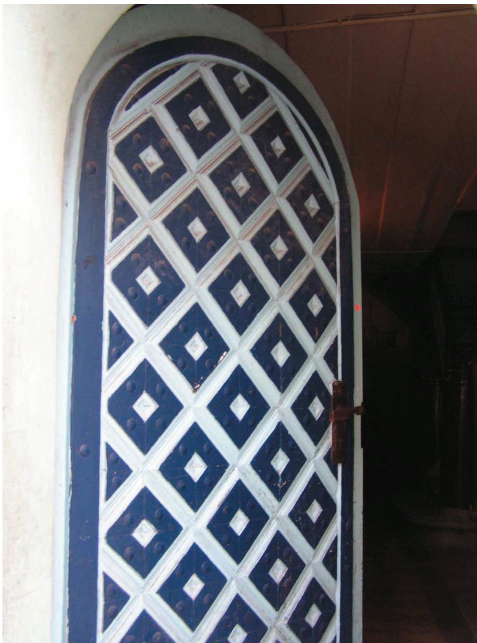
Chełmno, ul. Grudziądzka 36 Kamienica, drzwi wejściowe – do konserwacji i zachowania.