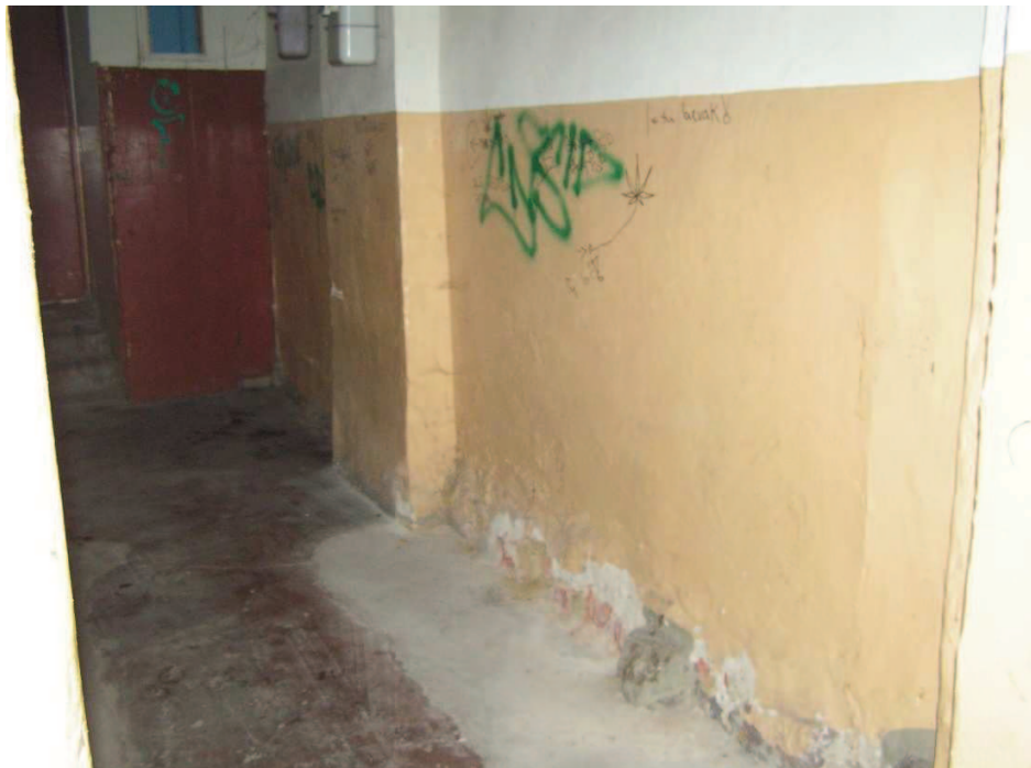
Chełmno, ul. Grudziądzka 36

Kamienica, wewnątrz sieni – widoczne uszkodzenia balasek, w głębi odpadająca farba i tynk ze ścian.