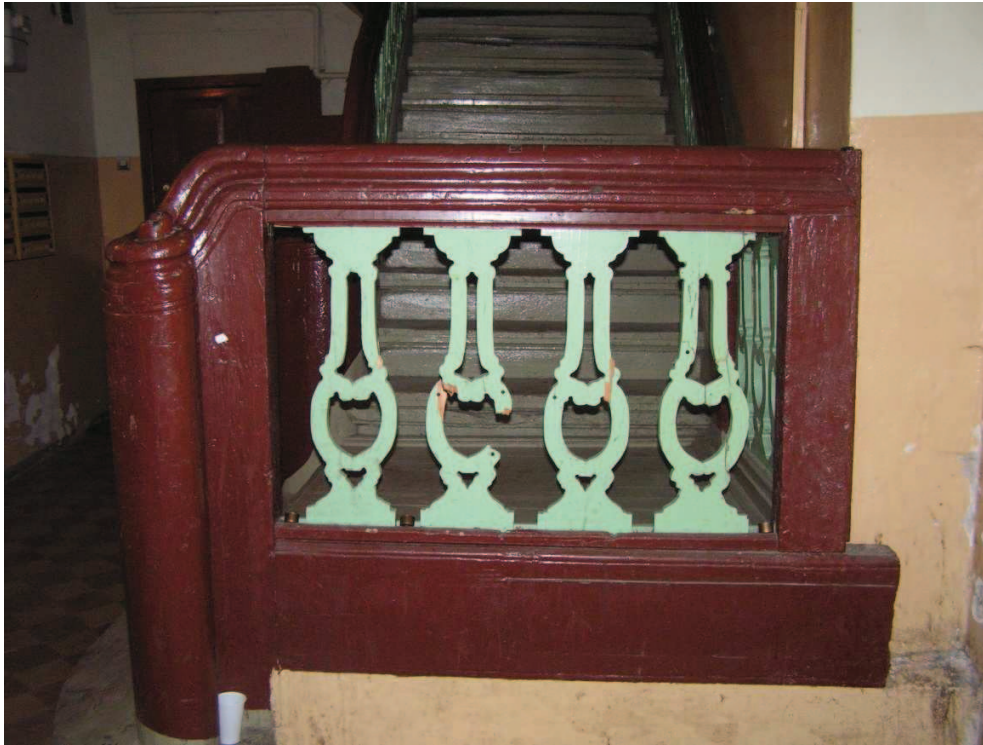
Chełmno, ul. Grudziądzka 36

Kamienica, wewnątrz sieni – widoczne uszkodzenia balasek, w głębi odpadająca farba i tynk ze ścian.