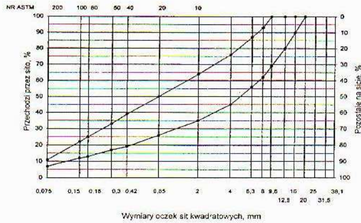
Rys. 1. Krzywe graniczne uziarnienia mieszanki mineralnej BA od 0 do 20 mm do warstwy ścieralnej nawierzchni drogi o obciążeniu ruchem dla KR1 lub KR2